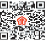
南平人力资源市场网二维码 (微信号为 npldiy)