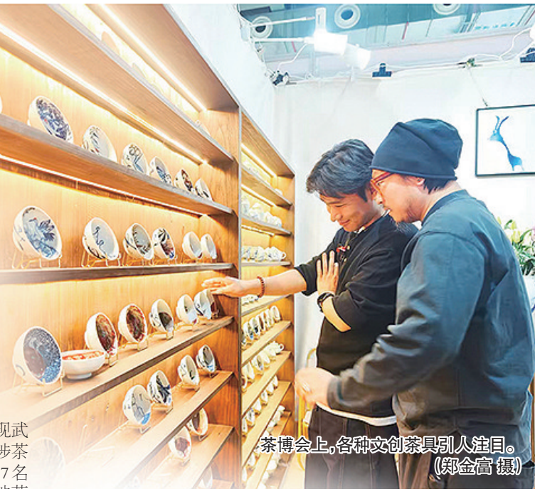
茶博会上,各种文创茶具引人注目。

在习近平总书记的重要指示精神指引下,近年来,新的茶文化力量、新的茶产业成果、新的茶科技理论在不断涌现。