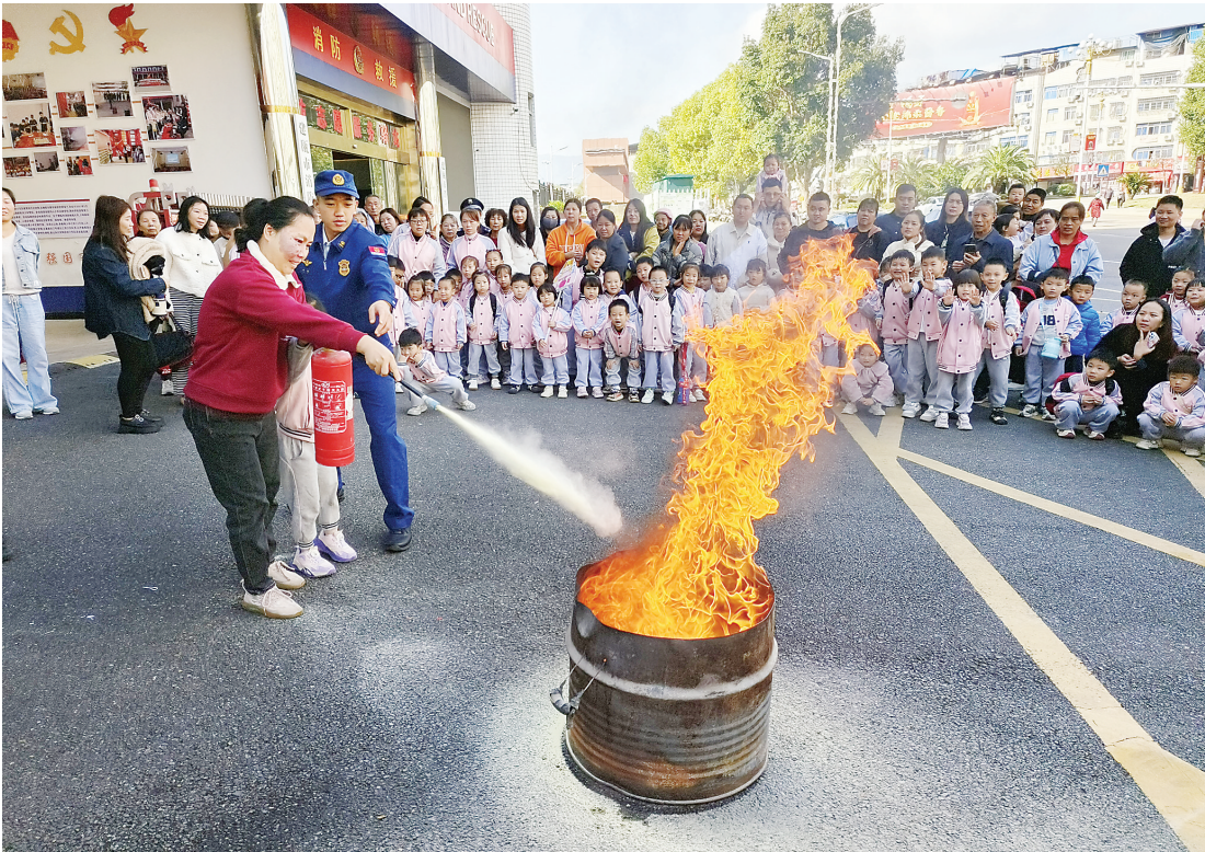
11月14日,建瓯市金苹果幼儿园120多名师生和家长走进建瓯水西路消防救援站,近距离学习消防、参与消防、体验消防。图为实操环节,消防员演示灭火器的操作步骤和初起火灾扑救方法,并指导师生和家长开展灭火演练。

为确保惠民安商实效,下一步,延平区法院要求干警铆足干劲,再接再厉,切实解决人民群众急难愁盼问题,为营商环境保驾护航。