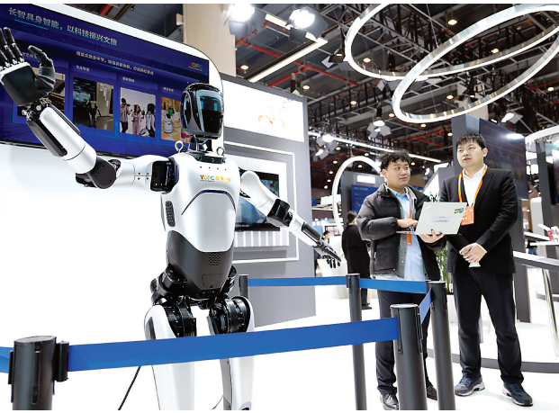
11 月 21 日，参观者在 2025 中国 5G+ 工业互联网大会展厅观看展出的全尺寸长飞一号机器人，该机器人具有感知、运控等功能。 11 月 21 日至 23 日，以“万物互联 智能领航”为主题的 2025 中国 5G+ 工业互联网大会在湖北武汉举办。

对大型网络平台的认定，征求意见稿提出，主要考虑的因素包括：注册用户 5000 万以上或者月活跃用户 1000 万以上；提供重要网络服务或者经营范围涵盖多个类型业务；掌握处理的数据一旦被泄露、篡改、损毁，对国家安全、经济运行、国计民生等具有重要影响。 征求意见稿指出，大型网络平台服务提供者应当明确个人信息保护工作机构，在个人信息保护负责人领导下开展个人信息保护相关工作，包括制定实施内部个人信息保护管理制度、操作规程以及个人信息安全事件应急预案；组织开展个人信息安全风险监测、风险评估、合规审计、影响评估、应急演练、宣传教育培训等活动，及时处置个人信息安全风险和事件等。 征求意见稿称，大型网络平台服务提供者应当为个人行使查阅、复制、更正、补充、删除、限制处理其个人信息，或者注销账号、撤回同意等权利提供便捷的方法和途径。