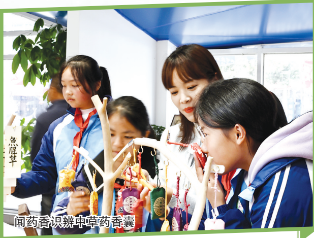
闻药香识辨中草药香囊

学校以“阅读分享”为钥匙,为孩子们打开了中草药知识宝库的大门。低年段的学生接触阅读中草药相关的绘本,中高年段的学生则是结合端午等传统节日,开展医药阅读等相关的文化活动。