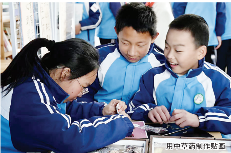
用中草药制作贴画