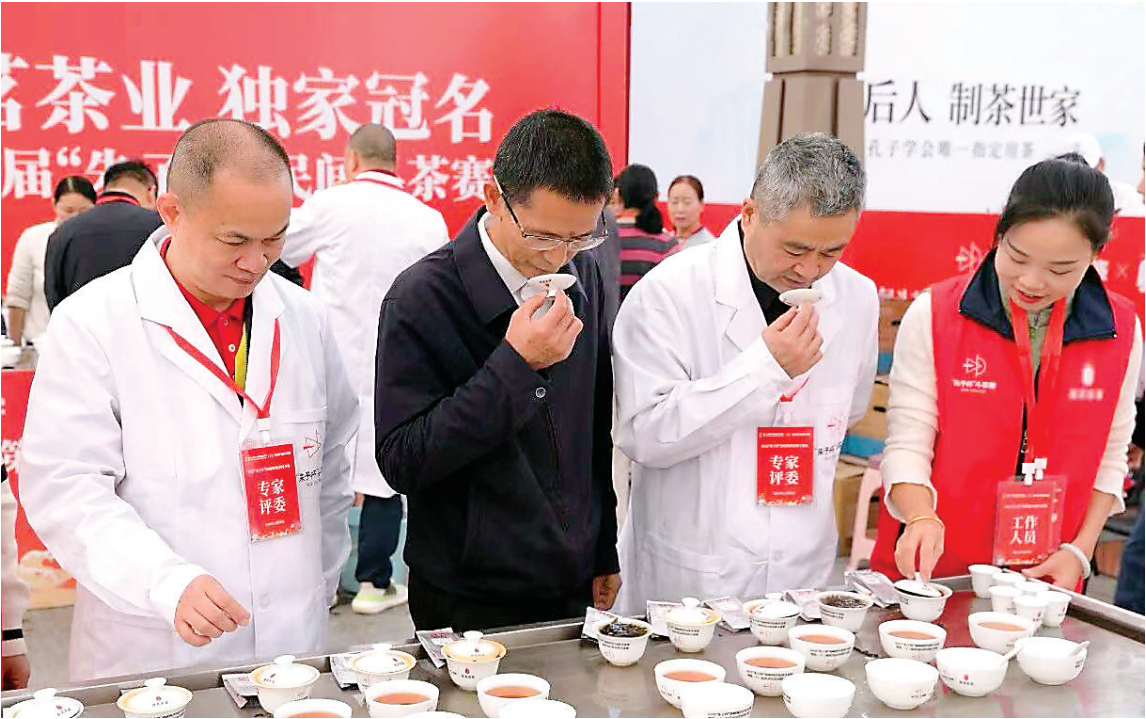
专家评审与大众评审结合的机制,让获奖茶样更具有代表性。

喜而言,赛事是技艺精进的“磨刀石”。2007年他首次以个人名义参赛,便斩获肉桂、水仙双状元。