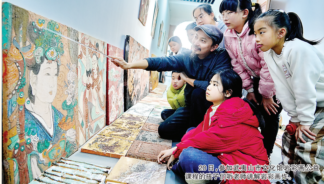
20日,参加武夷山市文化馆岩彩画公益课程的孩子们听老师讲解岩彩画作。