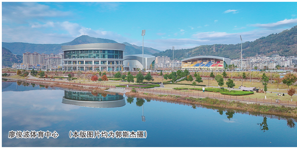
廖俊波体育中心

绿色发展理念同样贯穿工业转型全过程。政和经济开发区入选省级标准化建设激励名单,成功获评省级绿色工业园区与新型工业化产业示范基地;中国铸造协会专家服务站顺利落地,政和县当选中国铸造协会产业集群工作委员会轮值主任委员单位,为绿色工业发展注入强劲动力。