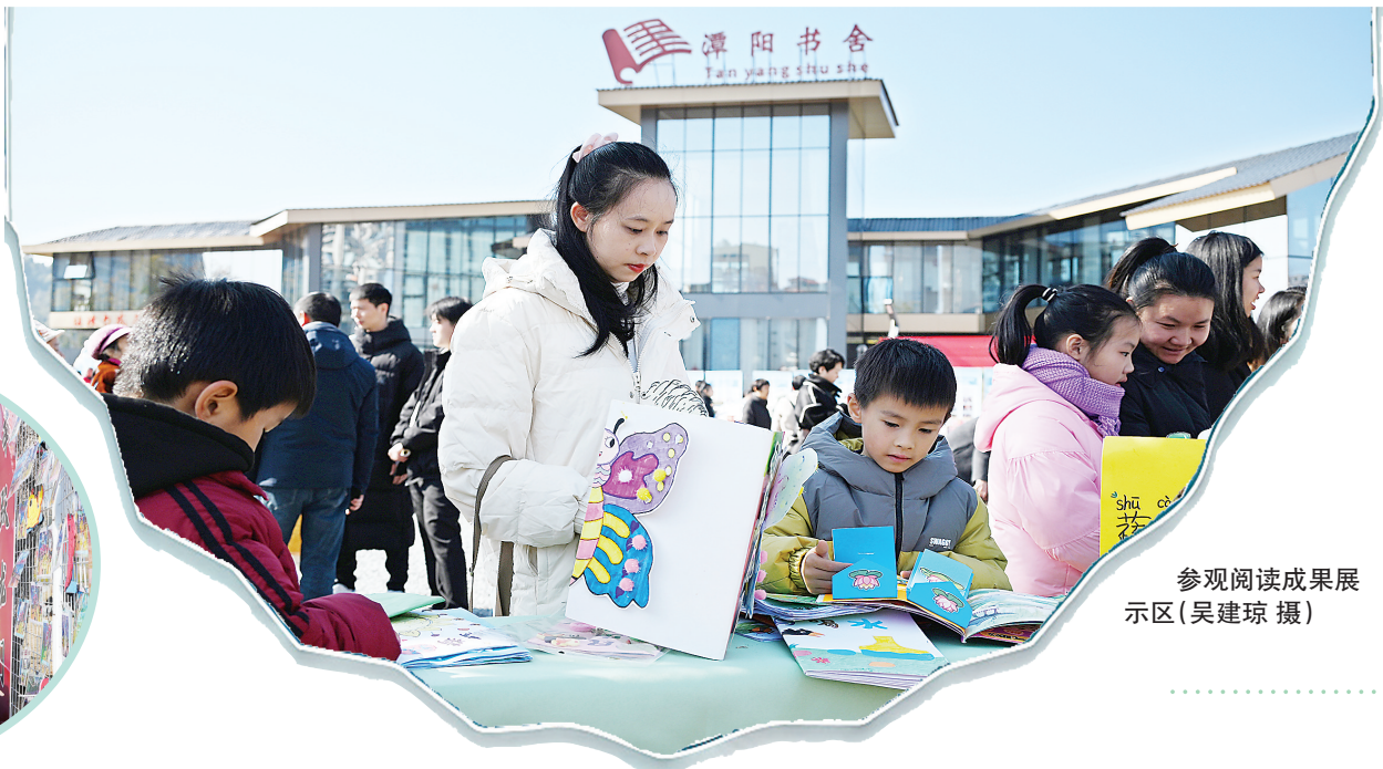
参观阅读成果展示区

冬月书香暖意浓。2025年12月27日,建阳区潭阳书舍·花海公益书吧广场前熙熙攘攘,一场以“立法促阅读·书香润潭阳”为主题的全民阅读活动在此举行。活动现场,丰富的阅读成果展示、文艺汇演及互动体验,让市民朋友们在休闲中浸润法治精神、尽享阅读之乐、感受文化魅力。