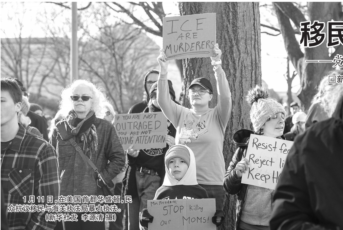
1月11日,在美国首都华盛顿,民众抗议移民与海关执法局暴力执法。

类交易;为企业或项目提供担保;开展承担无限责任的投资。财政部门、基金监管部门另有规定的从其规定。办法要求,本办法印发前已设立的政府投资基金投向领域不符合本办法要求的,以及同一地区同类基金较多、投资领域明显交叉重合的,应当依法依规及时调整并在存续期满后有序退出,同时在保障经营主体合法权益、维护市场秩序的前提下,鼓励相关基金整合重组。各级发展改革部门会同有关部门按照本办