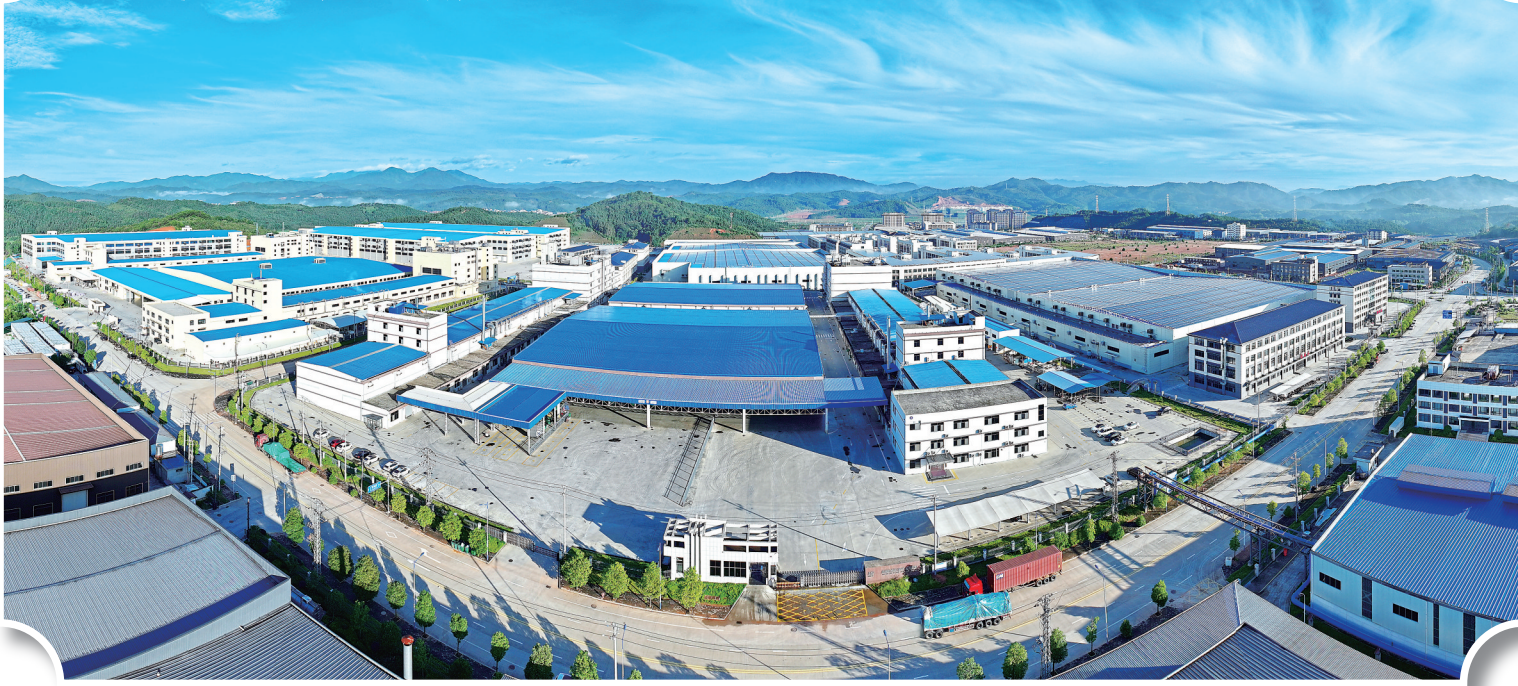
建阳经济开发区医卫产业园二期项目