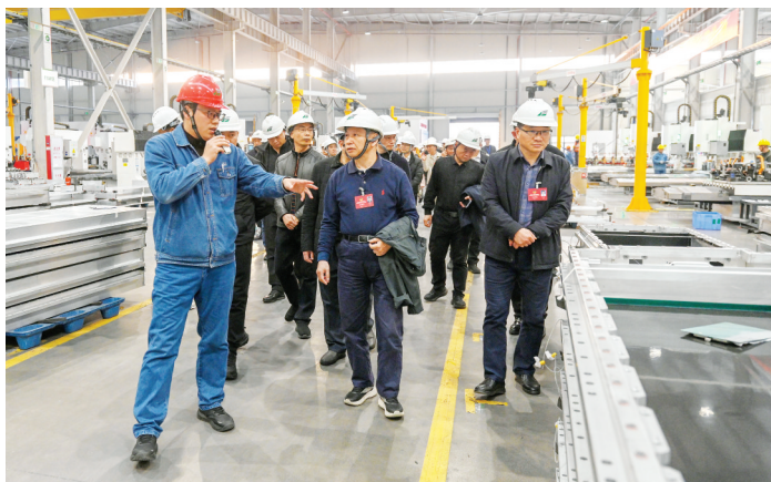
委员们视察武夷新区汽车零部件产业园铝轻量化项目。