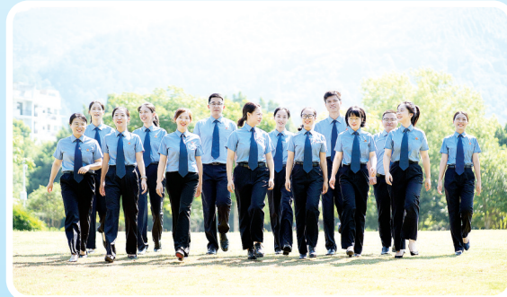
南平检察“夷树光”未爱联盟因保护妇女、未成年人权益突出,获评“福建省巾帼文明岗”称号。