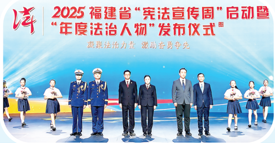
2025年12月4日,福建省“宪法宣传周”启动暨“年度法治人物”发布仪式在福州举行,南平市检察院第五检察部继荣获全国一等奖后,再获2025年福建省“年度法治人物”(集体)。