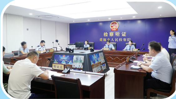
建瓯市检察院办理的“某金融借款合同纠纷再审检察建议案”入选最高人民检察院5件民事再审检察建议典型案例