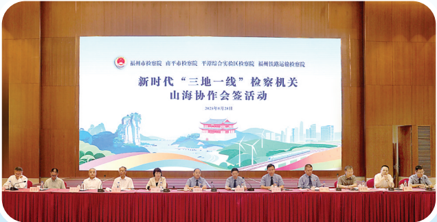
2025年8月28日,福州市检察院、南平市检察院、平潭综合实验区检察院、福州铁路运输检察院共同签署《新时代“三地一线”检察机关山海协作方案》,携手开启山海协同、路检联动的检察履职新篇章,推动构建从山顶到海洋的保护治理大格局。

面对数字时代浪潮,南平检察机关深入实施数字检察战略,全力融入“数字南平”建设大局。通过构建大数据法律监督模型,开展数据碰撞与类案分析,2025年全市依托数字监督成案137件,显著提升监督精准性与主动性。延平区检察院通过比对驾校学员数据与税务申报信息,发现并移送涉税线索,督促15家驾校补缴税款及滞纳金141万元,有效堵塞行业监管漏洞。武夷山市检察院