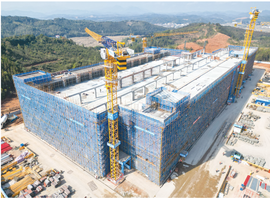
这是近日拍摄的建阳医卫材料产业园二期建设现场。该项目总投资约1.86亿元,主要建设多层厂房、污水处理池、事故应急池、固废收集间及垃圾收集点等,并配套建设项目规划用地范围内室外给排水、供电、道路、围墙及绿化等设施,目前主体结构施工加速中。项目计划3月底开始逐步移交企业安装生产设备,预计10月份整体竣工。

在全省率先出台市级实施方案,联合农发行开展政策巡回解读,首批谋划18个实施单元,计划投资66.35亿元,预计新增耕地2.54万亩,推动整治工作有序展开。 下一步,市自然资源局将以该项目为契机,继续发挥好全域土地综合整治的平台作用,强化对各实施单元的指导,统筹推进农用地整治、建设用地整理、生态修复和产业融合,优化国土空间布局,助力一二三产融合发展和城乡融合发展。