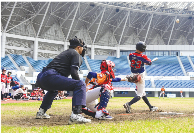
6日,闽台(南平)青少年棒球交流赛在南平市体育中心开赛。本次比赛由市体育局主办,8支队伍受邀参赛,其中4支队伍来自台湾地区。赛事期间,主办方还配套南平特色文化体验营等活动,推动两岸青少年在交流交往中建立常态化、长效化的情感联系。图为交流赛现场。

区的组织或个人,可依据《中华人民共和国国家公园法》处以最高十万元罚款;造成生态破坏的,将面临一百万元至五百万元的高额罚款,并须承担修复责任。如行为涉嫌犯罪,将依法追究刑事责任。此外,因非法穿越活动造成的人身财产损失、产生的救援费用等,均须由组织者及参与者自行承担。 科研、标本采集等确需开展的活动,须事先向武夷山国家公园管理机构提出申请,依法办理审批手续,并在批准范围内规范进行。 此次闽赣多部门联合发声,展现了跨区域、跨部门协同保护国家公园的执法决心,也为公众划清了行为红线,呼吁全社会共同守护好武夷山国家公园。