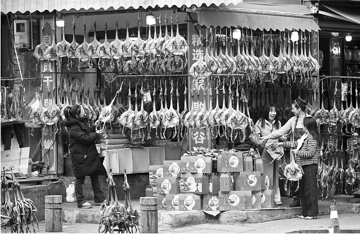
春节临近,位于建甌市管葡路主营传统风味的板鸭店迎来销售旺季,前来采购的市民络绎不绝。建甌板鸭为福建传统名优土特产品,素有“八闽佳肴”之美称,因口感独特、风味地道,成为当地群众春节餐桌上的不可或缺的传统美味。

“这份册子做得实用,我们常跑这段的都知道,前面弯道多、村子密。”长期在建阳从事短途货运的李师傅翻着交通安全手册频频点头。