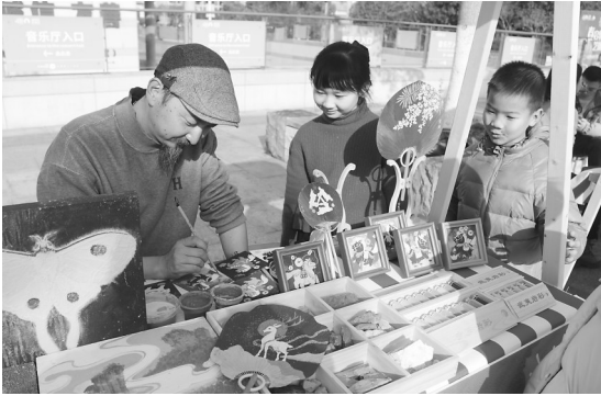
2月11日,“新岁雅集”非遗集市在武夷山市民广场热闹开市,现场集中展示武夷竹刻、建窑建盏、岚谷熏鹅等非遗技艺和美食,邀请书法爱好者书写春联、送“福”字。图为小朋友近距离感受岩彩画。