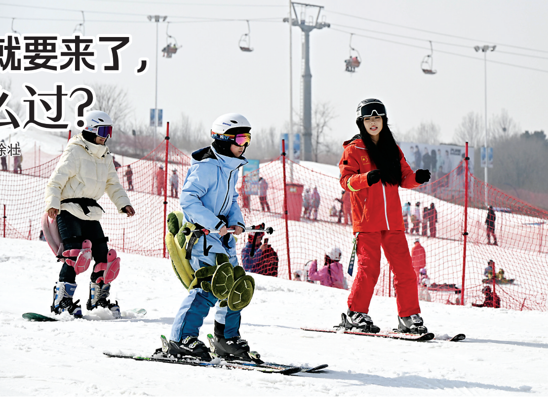
2月13日，游客在青岛西海岸新区融创藏马山滑雪场滑雪。

随着春节假期临近，青岛各大滑雪场陆续迎来游客高峰。当地以“冰雪+文化”“冰雪+旅游”聚人气、促消费、添年味。