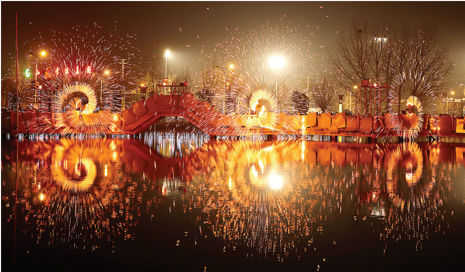
2月10日在山东省枣庄市中兴国家矿山公园拍摄的非遗“打铁花”表演。近年来，以潮汕英歌舞、蔚县打铁花、北京厂甸庙会、广东醒狮等为代表的非遗项目在春节期间越来越“出圈”，各地游客竞相跟着非遗民俗出游。

新春的阳光洒在修缮一新的屋顶上，暖意融融。像刘文富这样的年轻人回来了，老房子用起来了，茶景村的故事，又翻开崭新的一页。