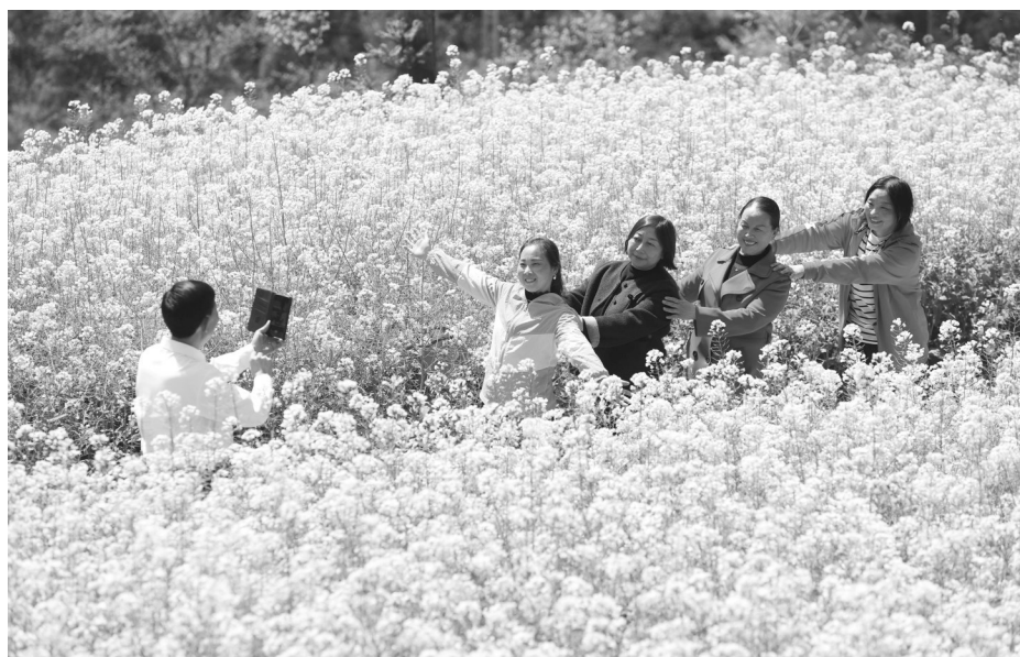
4月4日,游客在重庆市黔江区阿蓬江镇柴垵村五岭山露营地油菜花田游玩。清明小长假,人们走出家门,踏青游玩。

从流转30多亩田试种起步,到如今实现1500亩规模化种植,并组建起覆盖耕种管收全环节的现代化农机“战队”……返乡近10年,蔡文学和他创办的硕丰家庭农场,带动乡邻共同增收,成为当地农业转型升级的鲜活标杆。“希望通过我们的努力和示范,带动更多青年返乡种田,收获丰收的喜悦,让家乡既有绿水青山,也有金色粮仓。”蔡文学说。