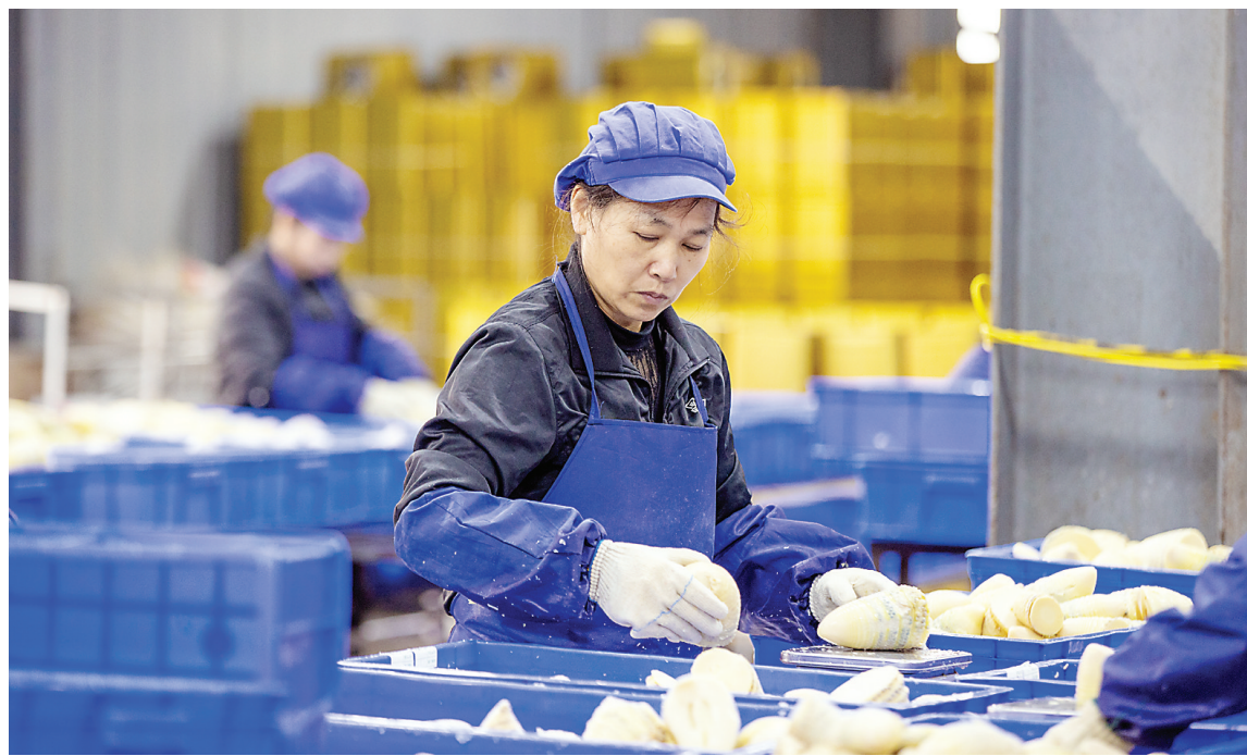
8日,在位于松溪县的福建新亚达食品有限公司的车间内,工人们在流水线上加工水煮笋。今年福建新亚达公司预计年产笋罐头超过10000吨,年产值将突破6000万元。随着新亚达等龙头企业产能持续释放,2026年松溪县春笋总产量预计超过40000吨,正加速将生态优势转化为经济优势,助力乡村全面振兴。