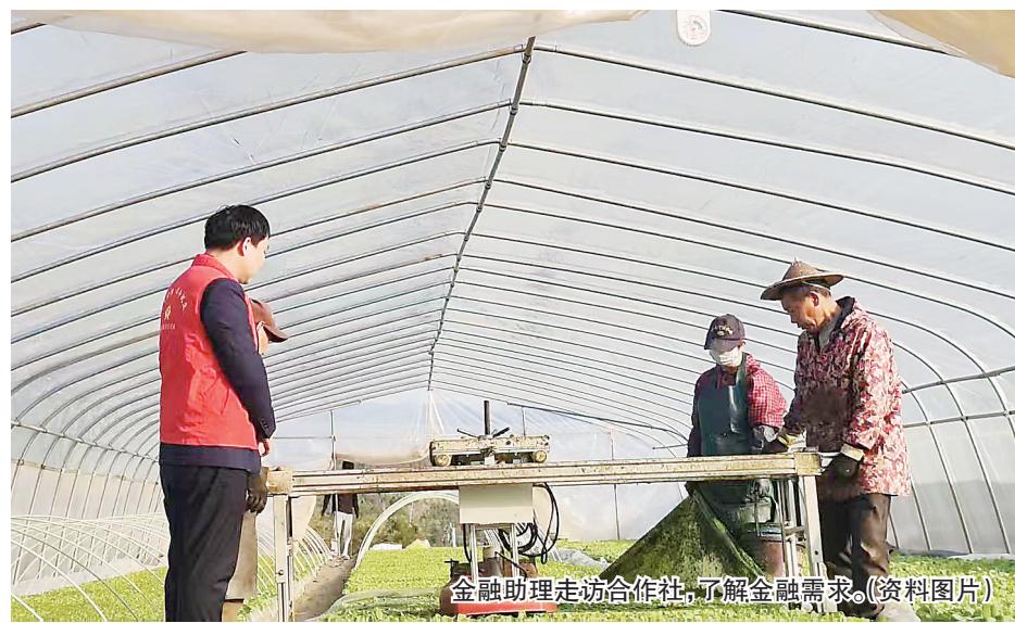
金融助理走访合作社,了解金融需求。(资料图片)

浦城农信联社创新推出“龙头企业贷”,成功破解“抵押难、融资难”瓶颈,让金融活水精准滴灌春耕一线。