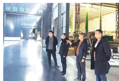
浦城农信联社相关负责人走访农业企业(资料图片)

春耕备耕,农业产业化龙头企业是带动粮食生产的“火车头”。面对企业储备农资、升级设备、扩大订单种植的迫切资金需求,