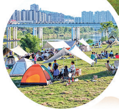
越来越多市民在崇阳溪漫游道露营