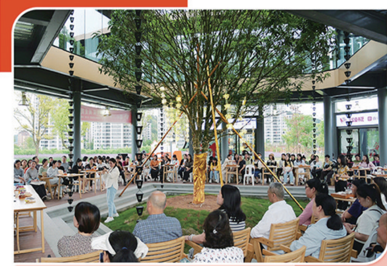
花海公益书吧举办阅读分享会

产业发展迈向新高度,民生福祉持续增进,城市形象大幅提升……站在“十五五”新起点上,建阳,这片充满活力的土地,必将以更加昂扬的姿态,续写高质量发展的精彩篇章。