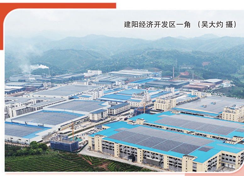
建阳经济开发区一角