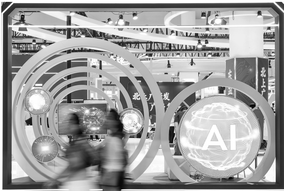
4月14日，人们走过第六届消博会主会场海南国际会展中心一处AI主题布景。在第六届中国国际消费品博览会上，AI赋能消费成为一大亮点。现场众多科技消费新品集中亮相，覆盖智能交互、穿戴设备、智慧健康等多个赛道。前沿科技与消费业态深度融合，科技创新为消费市场注入了强劲活力。