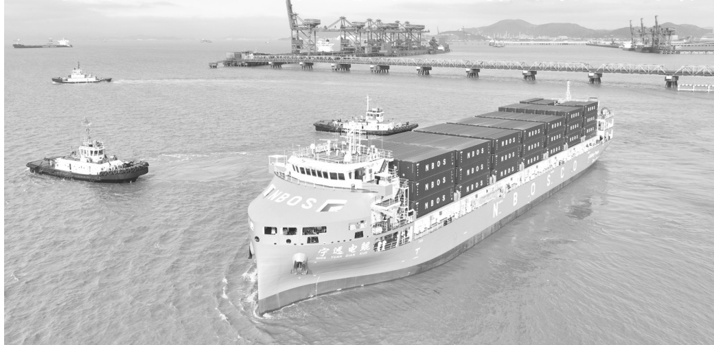
4月15日,纯电动智能集装箱海船“宁远电鲲”轮从宁波舟山港北仑港区启航,驶向嘉兴港乍浦港区(无人照照片)。当日,全球最大、国内首艘万吨级纯电动智能集装箱海船“宁远电鲲”轮从宁波舟山港北仑港区启航,驶向嘉兴港乍浦港区,标志着该船正式投入商业航线运营。