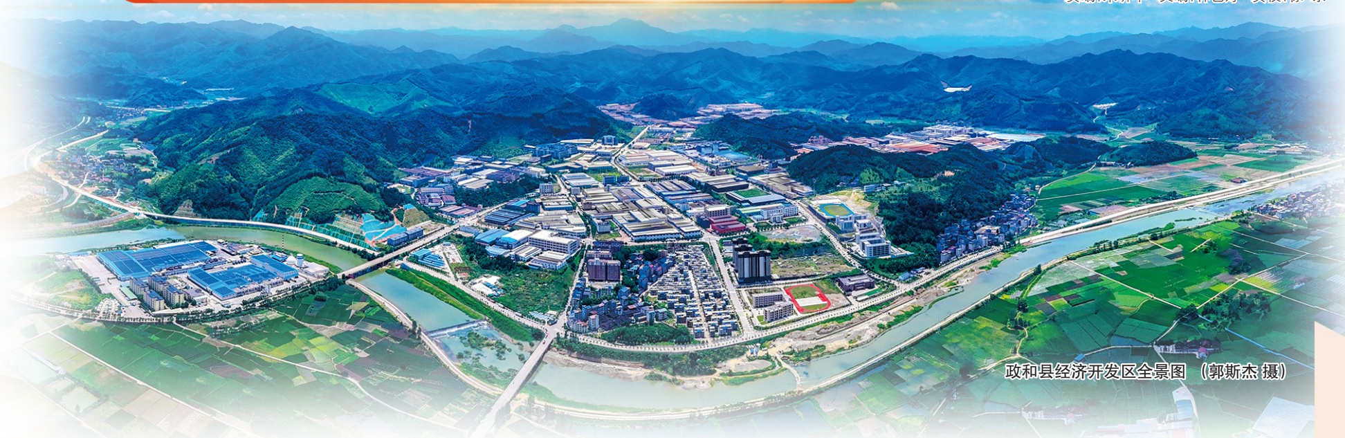
政和县经济开发区全景图