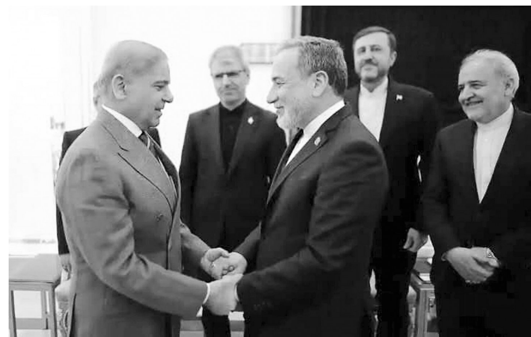
4月25日,巴基斯坦总理夏巴兹(左)在巴基斯坦首都伊斯兰堡同伊朗外长阿拉格齐举行会谈。伊朗外交部4月25日在社交媒体上发表声明说,伊朗外长阿拉格齐当天下午在巴基斯坦首都伊斯兰堡与巴基斯坦总理夏巴兹举行会谈,再次阐明伊朗有关停火和彻底结束战事的原则立场。

首先,双方围绕霍尔木兹海峡的较量不断升级。美伊近期在霍尔木兹海峡及其周边海域激烈对峙,美国持续封锁伊朗港口、阻碍伊朗航运;伊朗则用小型快艇“蜂群”式突击干扰相关海域通航。有分析指出,当前,美伊双方的海上对峙已成为政治耐力和谈判筹码的较量。