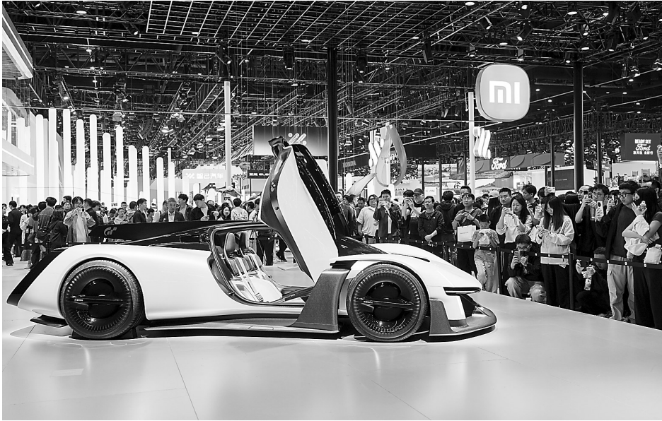
4月26日，在2026北京车展上，参观者在小米公司展台参观概念车小米Vision GT。 4月26日，2026(第十九届)北京国际汽车展览会迎来首个专业观众日，38万平方米的总展览面积、1451台展出车辆，其中181台首发车、71台概念车，吸引了众多参观者。

“整零同馆”的展陈布局，成为今年北京车展一道别样的风景线。核心供应商首次大规模进入主展馆，与整车品牌同台亮相，这反映出整车厂与供应商关系的重构；从过去单纯的供需采购，转向如今深度绑定的共