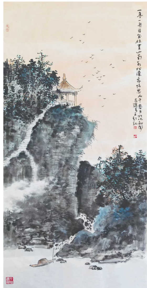
山间幽谷（国画）杨家骥作

行迹遍及南浦大地的陈襄，为官清廉，做人正直，那些云淡风轻的日子从未真正走远，其嘉言懿行永远光耀史册。