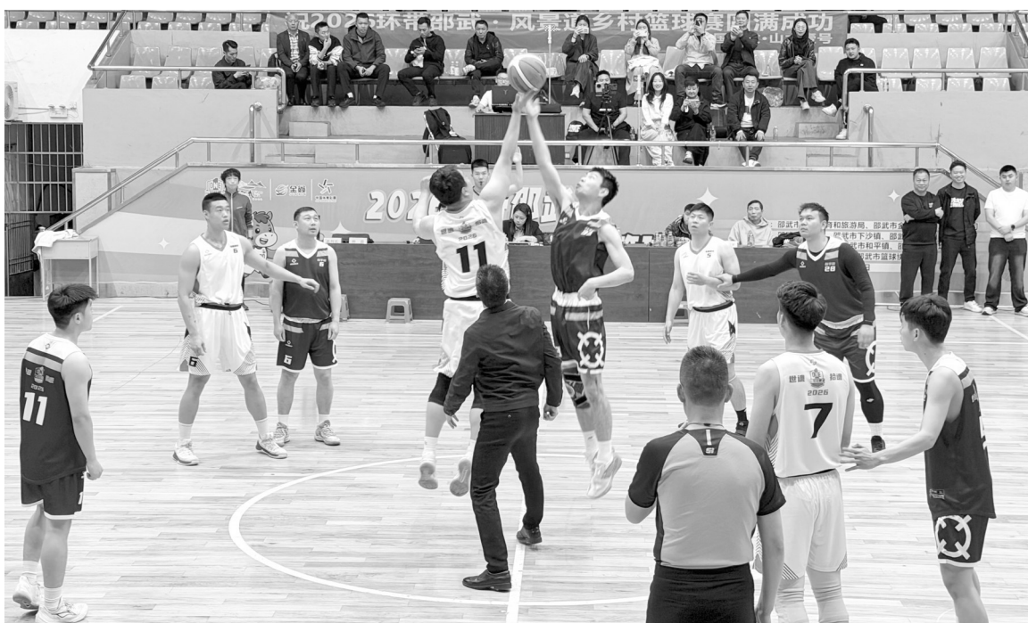
日前,“2026环带邵武·风景道乡村篮球赛”开赛,辖区7支球队以球会友、以赛聚力,展现邵武乡村活力。图为比赛现场。

从“种好一棵树”迈向“用好一片林”,路马头国有林场以林下产业为根基,文旅康养为延伸,林业文化为灵魂,盘活森林资源、挖掘生态价值,推动生态保护、产业发展与乡村振兴同频共振。