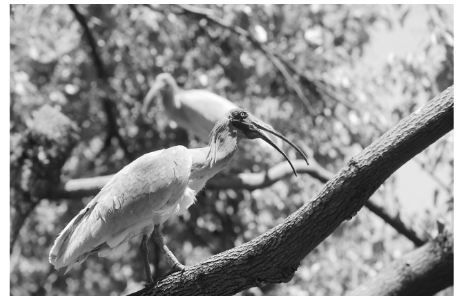
这是5月5日在浙江省湖州市德清县下渚湖朱鹮野化放飞地拍摄的朱鹮。

具体来看,公路人员流动总量为139172万人次,日均为27834.4万人次。其中,高速公路及普通国道非营业性小客车人员出行总量为119287万人次,日均为23857.4万人次;公路营业性客运总量为19885万人次,日均为3977万人次。