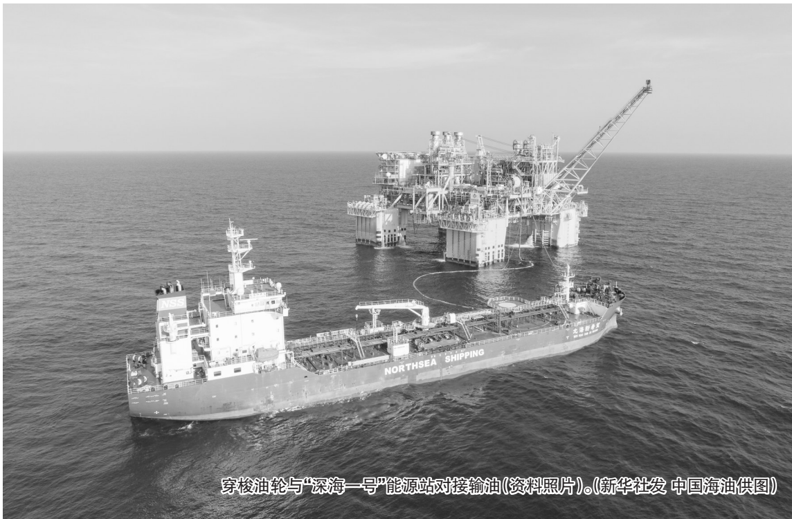
穿梭油轮与“深海一号”能源站对接输油(资料照片)。

这些诉求,不是在正式的汇报会上提出的,而是在车间角落、厂房门口、茶桌旁“拉家常”时说出来的。市政协班子成员深知,只有放下架子,企业家才会打开话匣子。“政府部门政策落实得怎么样?还有哪些需要改