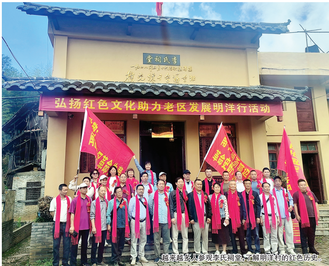
越来越多的人参观李氏祠堂，了解明洋村的红色历史。

初夏时节，笔者踩着晨雾，来到延平区南山镇明洋村。这座藏在延平、古田、建瓯三地交界的小山村，深藏着厚重的红色革命记忆，镌刻着闽北老区不屈的奋斗过往。