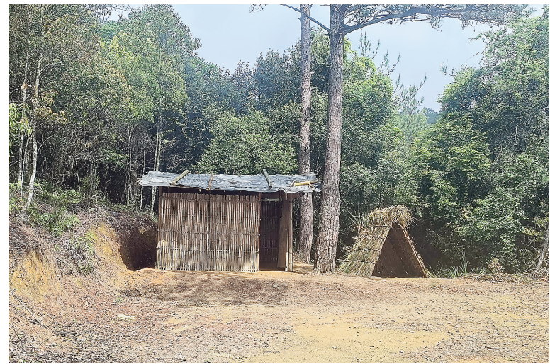
位于明洋村的中共闽浙赣省委机关电台遗址

革命精神从来没有远去，它藏在明洋村的红豆杉里，藏在村民们的实干里，藏在我们每一个人的脚下。我们走的每一步，都是在续写当年的长征路。愿这松风永续，愿这红色的火种，在八闽大地上，一代代传下去。