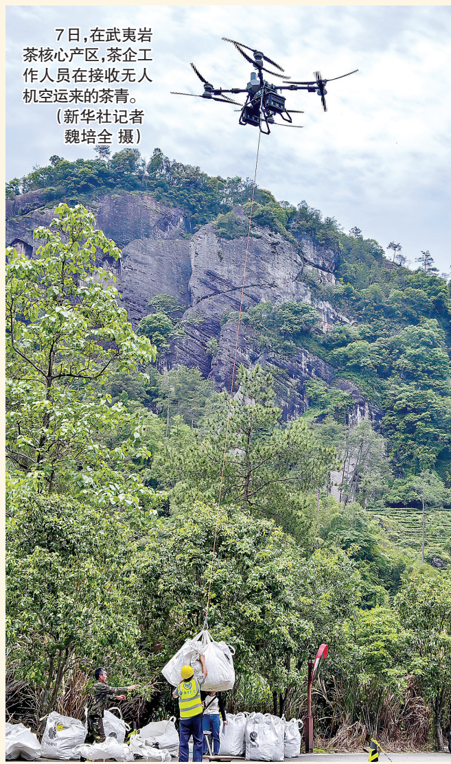
7日,在武夷岩茶核心产区,茶企工作人员在接收无人机空运来的茶青。