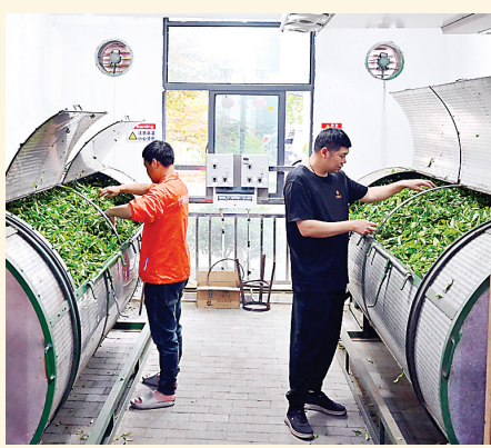
八日,武夷山市一家茶企技术人员用摇青机配合恒温设备做茶。