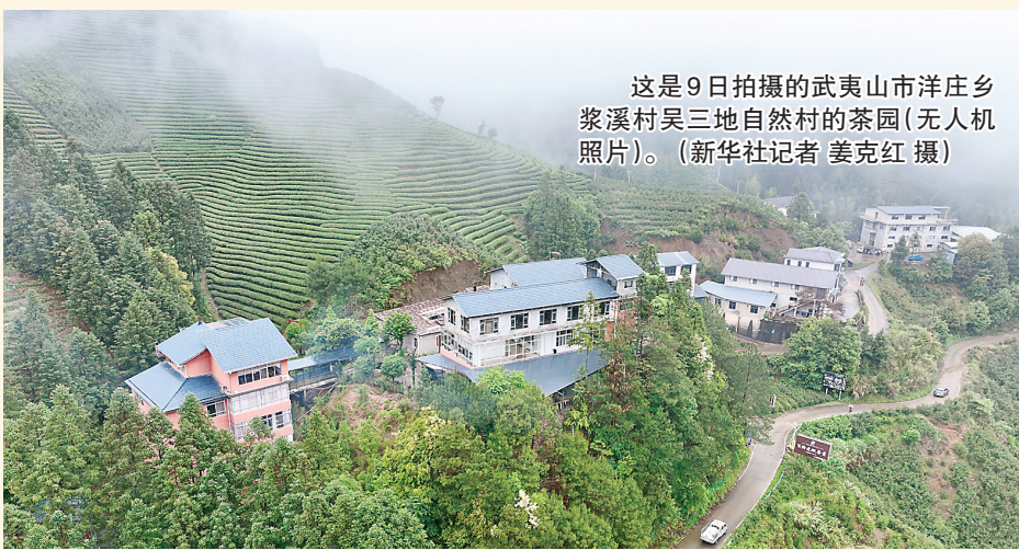
这是9日拍摄的武夷山市洋庄乡浆溪村吴三地自然村的茶园(无人机照片)。

5月以来,福建武夷山进入春茶采摘初制关键时节,茶农抢抓农时采茶青、忙初制。从茶园鲜叶采摘到工坊加工制作,从坚守古法制茶技艺到现代化茶科技赋能,武夷山传承千年的茶叶,在传统与现代的交融中焕发蓬勃生机。