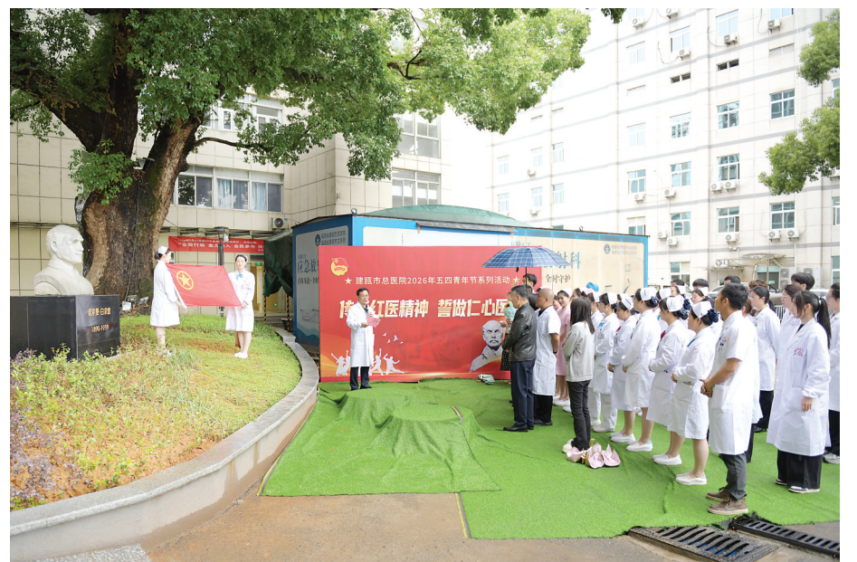
为传承红色基因,弘扬白求恩救死扶伤、无私奉献的崇高精神,厚植医者情怀,9日,建瓯市总医院在该院院内白求恩雕像前举行“传承红色基因,誓做仁心医者”重温医者誓言主题活动。图为活动现场。

肺功能检查是诊断哮喘的金标准,简单无创且易于配合。同时,胸闷的病因较为复杂,诊断过程中需注意排查冠心病、心律失常、食管反流等其他可能疾病,做到全面评估、精准治疗。