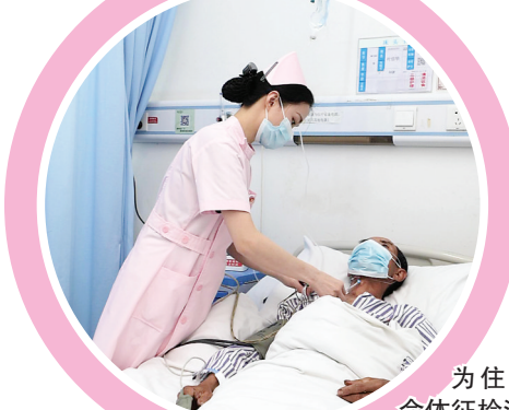
为住院患者做生命体征检测