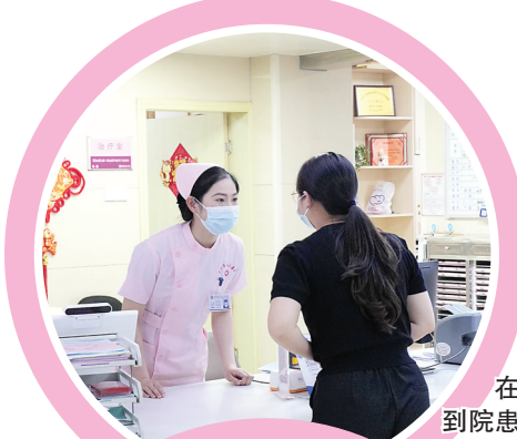
在护士站接诊到院患者