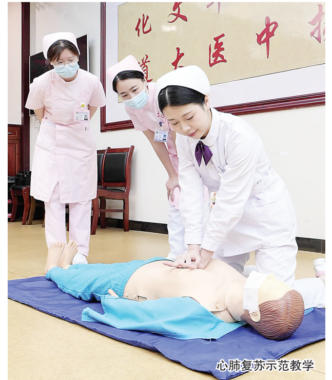
心肺复苏示范教学

心肺复苏是与死神赛跑的标准化急救技能,要求操作迅速、持续且力度频率精准。操作时首先要快速判断患者意识与呼吸,10秒内确认心跳呼吸骤停后立即呼救并开始胸外按压;按压位置在两乳头连线中点,双手交叠垂直下压5至6厘米,频率每分钟100到120次,每次按压后要让胸廓充分回弹,中断时间不能超过10秒。人工呼吸前需清理口腔、仰头抬颌打开气道,捏住鼻子吹气看到胸廓隆起,按30次按压配2次呼吸的比例持续操作,直到患者恢复自主呼吸和心跳。