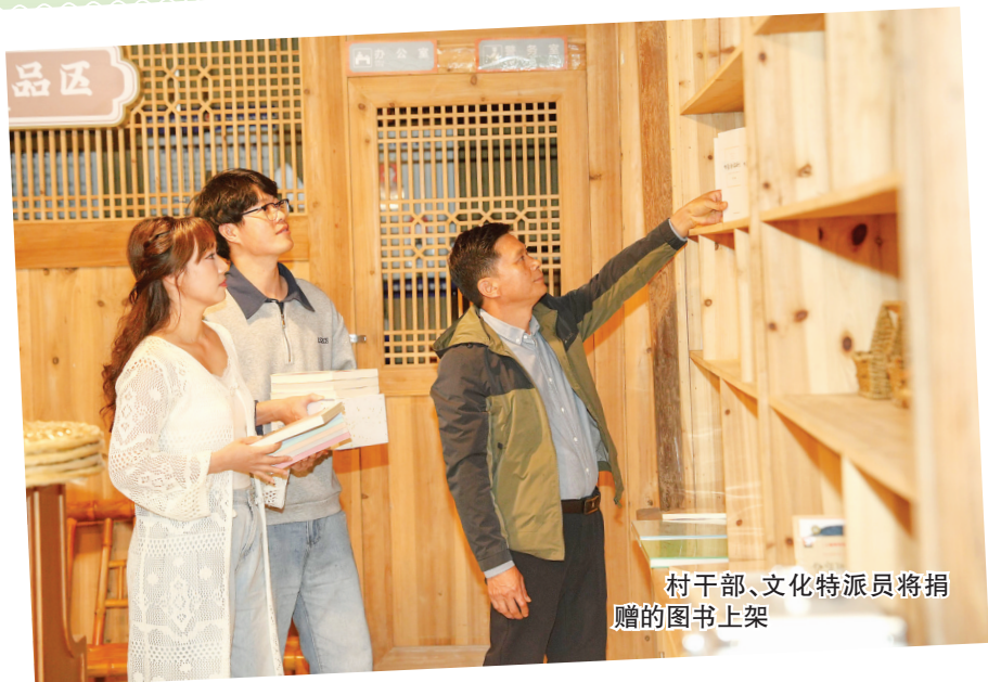
村干部、文化特派员将捐赠的图书上架