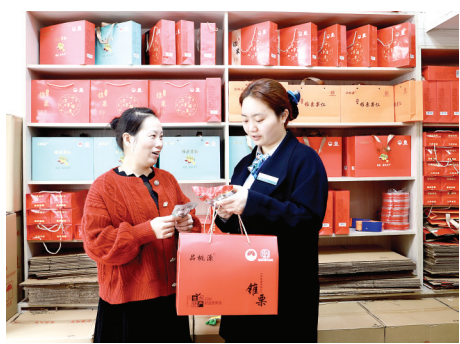
农行建瓯支行客户经理走访九和食品,对接企业金融需求。

人穿梭。从剥壳、选果到蒸煮、包装,每一道工序都藏着对品质的执着。正因为无添加、口感软糯、品质稳定,九和食品逐渐成为建瓯地理标志产品“建瓯锥栗”的代表性品牌之一。如今,产品也从最初的散装原栗,发展为即食锥栗、脱壳栗仁、糖炒栗子等系列,实现了从粗加工到精加工的跃升,也让这一地方品牌的辨识度与附加值不断提升。