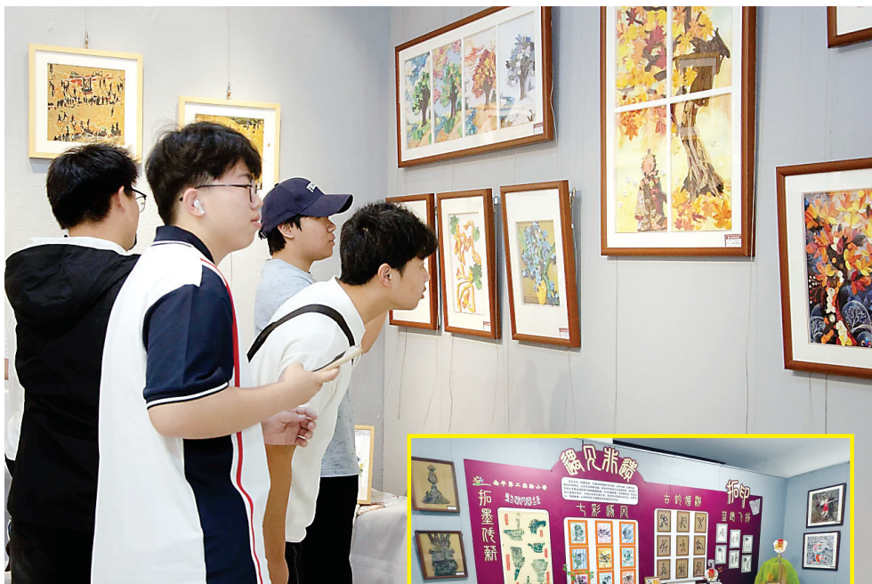
学生们参观成果展艺术作品