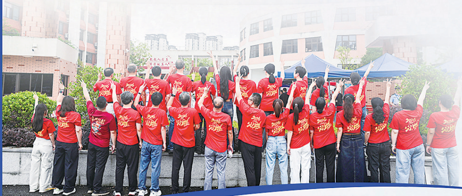
7日,南平一中武夷校区高中部考点外,老师们身着“旗开得胜”定制服装为学生加油。