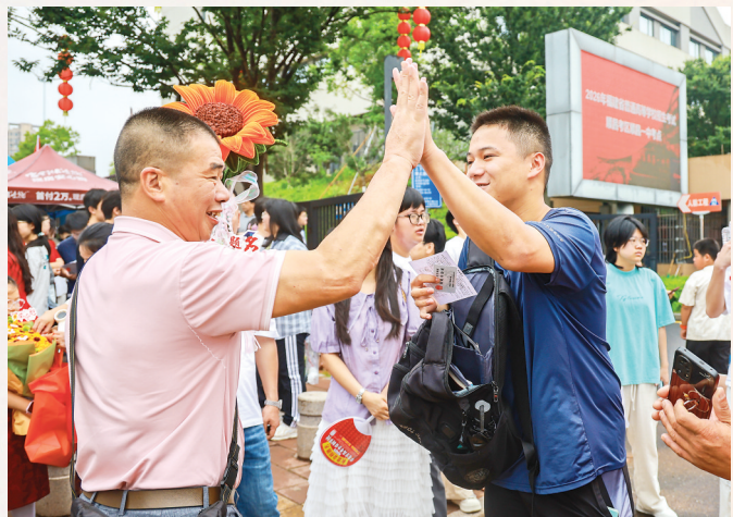
7日上午,在顺昌一中(富州校区)考点外,老师与考生击掌,为考生鼓劲。