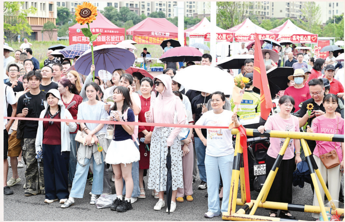
家长手持向日葵,预祝考生“一举夺魁”。