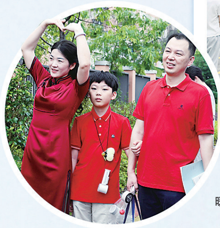
家人身着红色衣服暖心送考。

又是一年高考时,6月7日是高考首日,本报记者分赴南平一中武夷校区高中部、南平一中紫云校区、建阳一中、武夷山一中、顺昌一中(富州校区)等多个考点,记录下考场外的爱与期盼。家长们身着特色服饰、手捧向日葵花式送考,公安民警、医护人员等坚守岗位、全力护航。一句句暖心寄语、一个个温暖拥抱、一束束缤纷鲜花,汇成考场外最动人的风景。