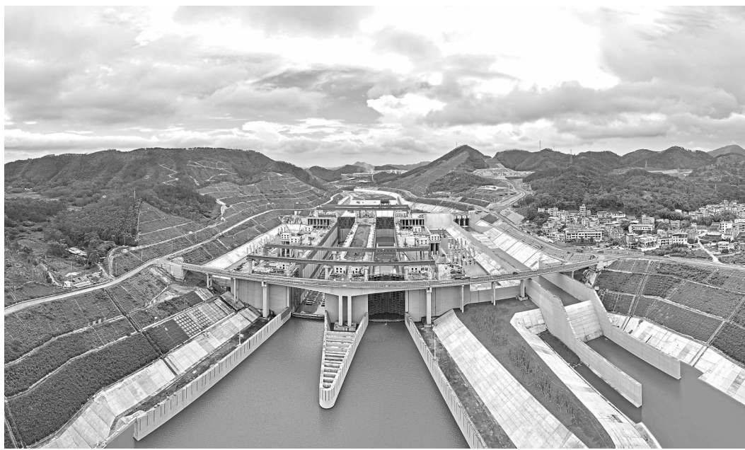
6月6日拍摄的平陆运河马道枢纽(无人机照片)。

马道枢纽坐落于广西钦州市灵山县旧州镇,是平陆运河三级阶梯的第一梯级枢纽。该枢纽拥有多项世界级优势:世界在建最大的内河省水船闸,闸室面积相当于1.5个足球场,能同时容纳多艘大船;世界最高水头的内河省水船闸,水位落差达29.6米,解决了大落差通航难题;闸门启闭速度世界最快,每个重达70吨的工作闸门开门仅需1分钟、关门只要30秒。