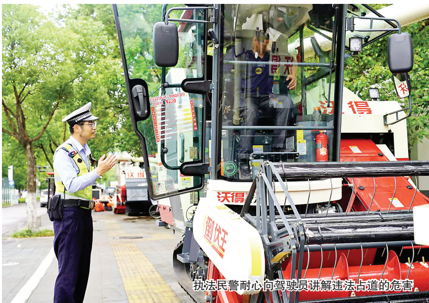
执法民警耐心向驾驶员讲解违法占道的危害。

据了解,此次非法占用停车资源专项整治从5月底开始,将持续三个月。下一步武夷山将持续深化联动执法,开展常态化全域排查整改,从严整治各类停车乱