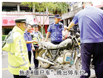
拖走“僵尸车”,腾出停车位。

一边是路面执法的“硬治理”与空间挖潜的“增供给”,另一边是技术赋能的“软服务”。日前,武夷山市智慧停车平台