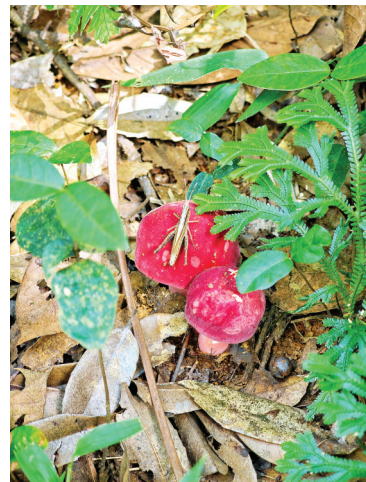
风水林里生长的红菇

如果你问我,绿水青山究竟能“长出”什么好东西?我会告诉你,来到松溪县渭田镇巨口村,答案就写在清晨的薄雾里,写在千年风水林的苍翠间,也写在红菇破土而出的那一抹嫣红里。