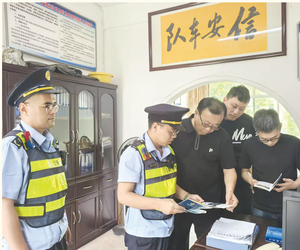
为规范道路运输经营秩序,6月17日,南平高速执法支队五大队结合安全生产月,到辖区烟花爆竹、危化品运输企业开展上门走访、普法宣传及政策解读活动。图为执法人员在企业宣传危化品、烟花爆竹运输相关法律法规。