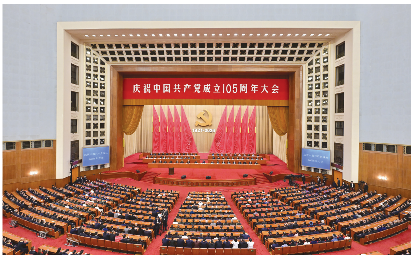
7月1日上午，庆祝中国共产党成立105周年大会在北京人民大会堂隆重举行。

新华社北京7月1日电 庆祝中国共产党成立105周年大会7月1日上午在北京人民大会堂隆重举行。中共中央总书记、国家主席、中央军委主席习近平向“七一勋章”获得者颁授勋章并发表重要讲话。他强调，105年来，我们党始终坚守为中国人民谋幸福、为中华民族谋复兴的初心使命，在不懈奋斗中创造了彪炳史册的伟大成就。新征程上，全党同志要坚定信心、接续奋斗，不断创造无愧于时代和人民的新业绩。