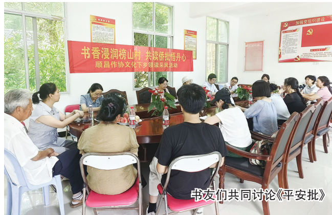
书友们在共同讨论《平安批》

7月4日,顺昌县作家协会溪畔读书会走进郑坊镇榜山村,开展文化下乡领读采风活动。活动在榜山村村部会议室开展,十余位书友与村民齐聚一堂,共赴乡村书香之约。