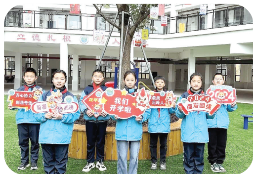
政和县元峰小学同学们在教室里手持龙年“目标卡”,许下新学期的心愿。