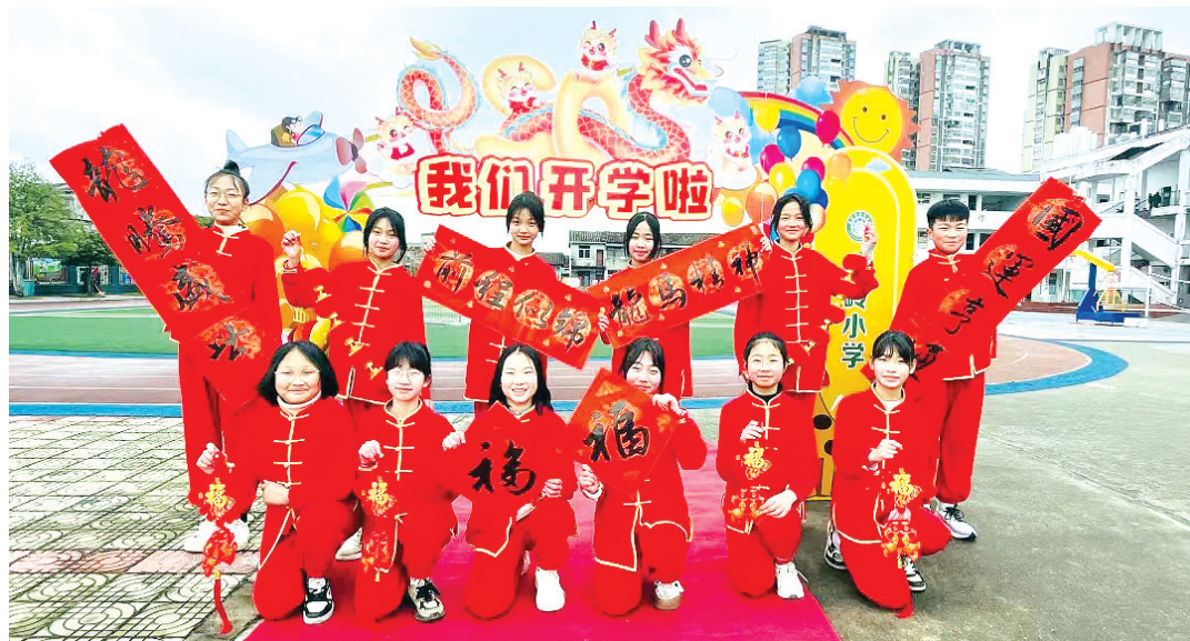
光泽县镇岭小学的同学们戴“红”相迎,用满满的仪式感开启新学期。

26日,全市中小学、幼儿园迎来新学期,各所学校热闹起来了!同学们怀揣着期待重返熟悉的校园,一起去看看热闹的开学典礼吧!