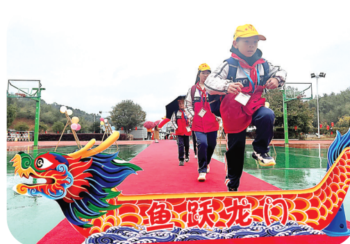
建州教育总校一中附小的同学们跨过“龙门”,迈向新学期。