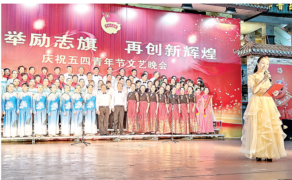
高举励志旗,再创新辉煌。5月4日,南平市文化流促进会、南平市老团干活动中心等单位在延平区激情广场共同举办庆祝五四青年节文艺晚会。图为演出现场。

事后,两人谁都没把这件事放在心上,没想到这位女乘客还送来一封感谢信。对此,黎守荣和谢素珍都觉得自己只是做好本职工作:“作为公交人,服务好广大乘客是我们的分内之事。”