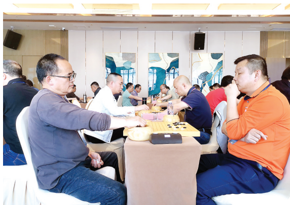
5日,围棋爱好者纹秤对弈。经过三天共七轮的激烈角逐,当日,南平市职工围棋赛暨业余围棋锦标赛在延落下帷幕,决出个人前三名和团体前六名。