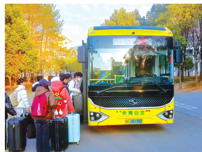
武夷学院学生乘坐“返乡专线”,踏上回家路。

据悉,今年的学生返乡专线于1月10日至11日开行,两天内共运行12趟次,接送学生约400人次。